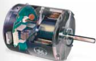
Moteur vitesse variable (optionnel)