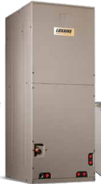
Souffleur une pièce (AHE-AHV) avec évaporateur