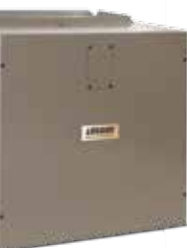
Souffleur modulaire (MX-MV)